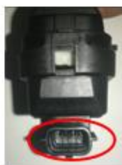
Conector 3 Pinos