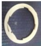
Anel de Vedação