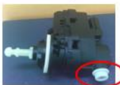
Volante de ajuste Manual