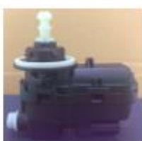
Unidade de ajuste de altura do feixe luminoso dos faróis